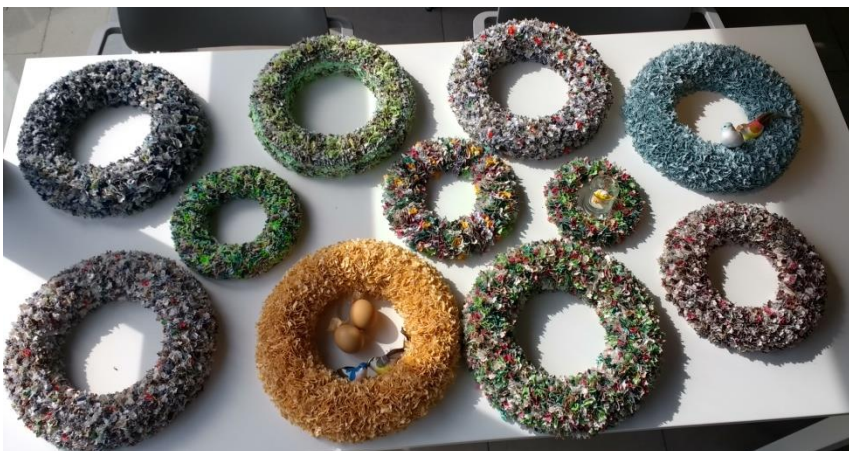
Het mooie resultaat van een maand kransen maken, tijdens het hobbymoment in Ter Wezell!