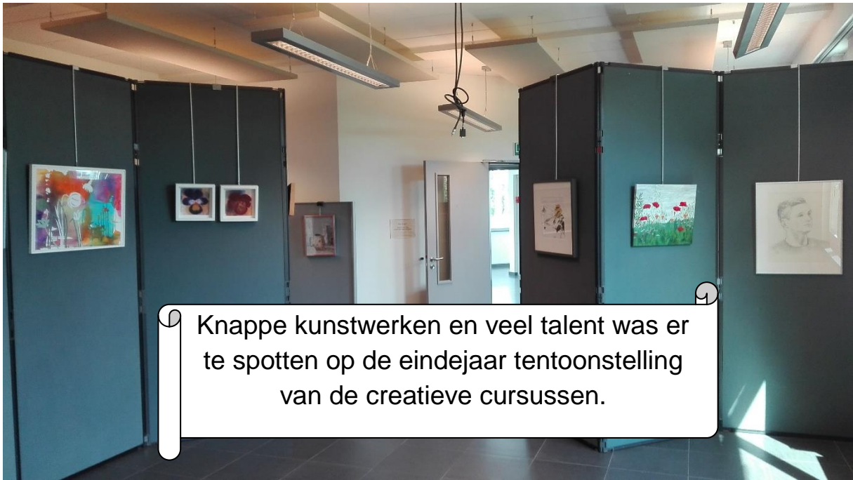
Knappe kunstwerken en veel talent was er te spotten op de eindejaar tentoonstelling van de creatieve cursussen.